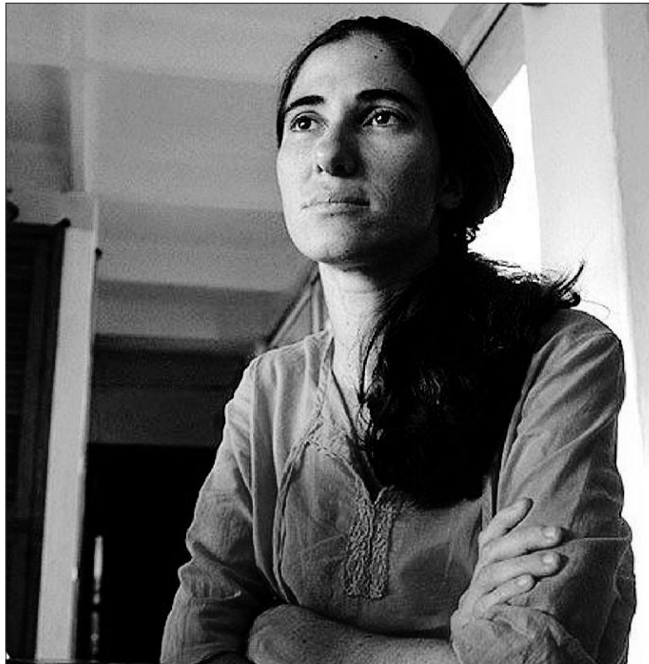
Yoani Sánchez, definita «la fionda di Davide contro Fidel Castro», ha scritto "Cuba libre" che arriva in Italia edito da Rizzoli

«A me piacerebbe tantissimo materializzare questo viaggio, ma non lo credo. Il governo cubano non potrebbe mai autorizzarmi, se lo facesse dovrebbe fare altrettanto per i tanti altri casi simili al mio che si stanno moltiplicando nell'isola. In questo momento delicato, di transizione non se lo può permettere. Qualsiasi cambiamento